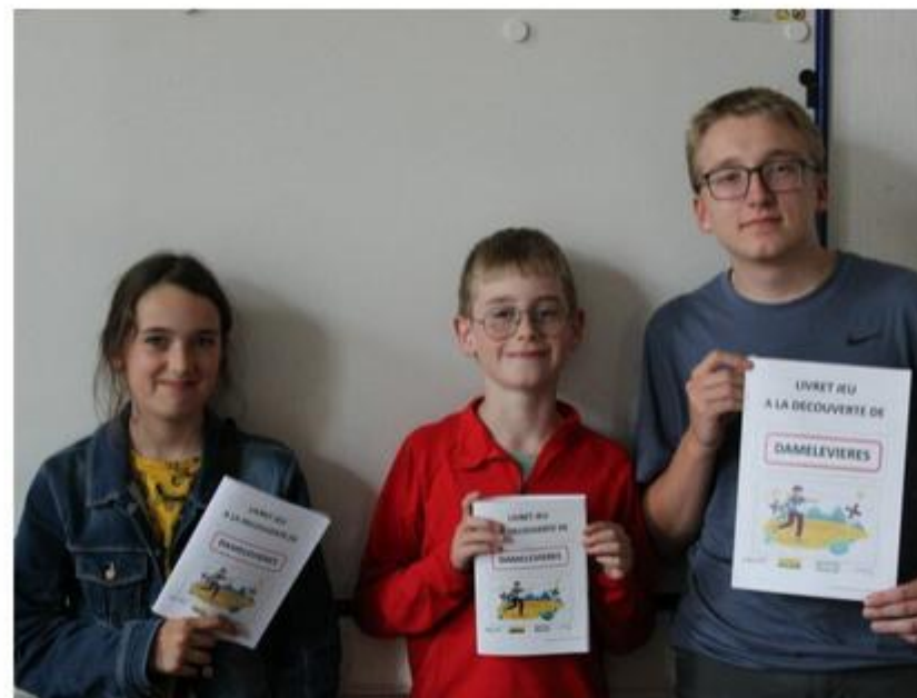
Les jeunes du CMEJ ont créé un livret d'accueil destiné aux habitants.